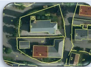
DOP mit DFK