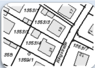
Digitale Flurkarte (DFK)