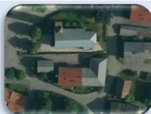
Digitales Orthophoto (DOP)