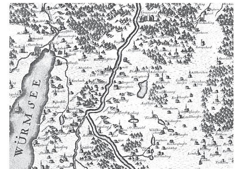
Ausschnitt aus Blatt II, München