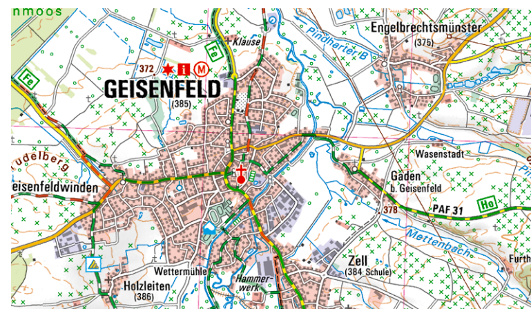
Ausschnitt aus UK50-34 Pfaffenhofen a.d.Ilm – Neuburg-Schrobenhausen

Und nicht zu vergessen – das Wittelsbacher Land, die „Wiege Altbaierns“, sowie die ehemalige Landesfestung Ingolstadt.