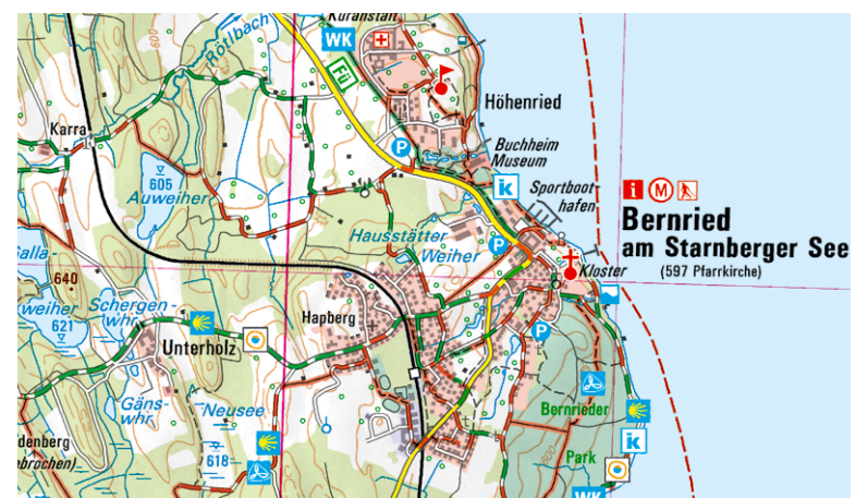
Ausschnitt aus UK50-41 Ammersee – Starnberger See – München Süd

Was bietet die Gegend noch? Kleinode der Natur wie die Osterseen, historische Altstädte wie Wolfratshausen und Weilheim, die Isar mit ihrer Floßfahrt, der Pupplinger Au und Burg Grünwald, aber auch die berühmte Seenschifffahrt - auf dem Ammersee sogar auf historischen Raddampfern. Schiff ahoi!