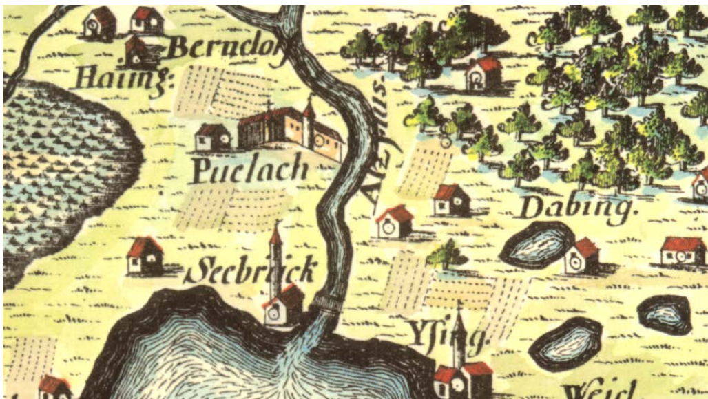
Der kolorierte Ausschnitt der Pusch-Kopie des Blattes „Chiemsee“, vermittelt einen Eindruck von der damaligen Wirkung der Großen Karte. Die eingetragenen Seen um „Dabing“ (heute Tabing) sind mittlerweile ausgetrocknet.

Die Topographische Zweigstelle des Bayerischen Landesvermessungsamts (Nachfolgedienststelle des Bayerischen Topographischen Bureaus) veröffentlicht ca. 10 Jahre später zwei Verkleinerungen 1:90000 mit dem Gebiet um München mit seinen Voralpenseen. Diese beiden, besonders reizvollen Blätter werden im Jahr 1940 erneut veröffentlicht und sind auch heute noch mit zehn weiteren Faksimile-Ausgaben der Pusch'schen Kopien im Originalmaßstab 1:45000 im Handel erhältlich. Bedauerlicherweise sind im zweiten Weltkrieg alle anderen Pusch-Kopien durch Kriegseinwirkungen verloren gegangen.