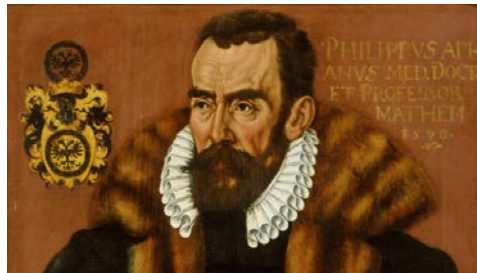
Philipp Apian (1531–1589)

Herzog Albrecht V. von Bayern beauftragt im Jahre 1554 den erst 23-jährigen Ingolstädter Mathematik-Professor Philipp Apian, das Herzogtum Bayern genau zu vermessen und eine exakte Landkarte („mappa“) anzufertigen. Das mathematische Können Apians in Verbindung mit seinen Fähigkeiten in Astronomie, Instrumentenkunde und Kartografie gewährleisten eine wissenschaftlich fundierte Vorbereitung und Ausführung dieser Aufgabe. Vorausschauend wählt er für seine Karte mit 1:45000 einen relativ großen Maßstab, damit er ausreichend Details erfassen kann. Auf Apian wartet ein zu bearbeitendes Gebiet von etwa 50 000km 2 ohne befestigte Straßen, mit reißenden Flüssen, dichten Wäldern und gewaltigen Bergen.