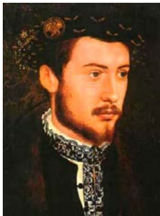
Herzog Albrecht V. von Bayern